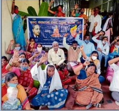
ಕೆ.ಆರ್.ಪುರ ತಾಲ್ಲೂಕು ಕುಳಿಬೆರೆ ಎದುರು ಪ್ರತಿಭಟನೆ ನಡೆಸಿದ ನಿರಾಶ್ರಿತರು

ದಿಡೀರ್ ನಡೆದ ಕಾರ್ಯಾಚರಣೆಯಿಂದ ದಿಕ್ಕು ತೋಚದಾದ ಗುಡಿಸಲು ನಿವಾಸಿಗಳು, ಪಾತ್ರೆ, ಪಾಸಿಗೆ, ಬಟ್ಟೆ ಹಾಗೂ ಇನ್ನಿತರ ವಸ್ತುಗಳನ್ನು ಹೊತ್ತು ಸಾಗಿದರು. ಕಾರ್ಯಾಚರಣೆ ಆರಂಭವಾಗುವ ಹೊತ್ತಿಗೆ (ಬೆಳಿಗ್ಗೆ 11) ಕೆಲವರು ಕಲಸಕ್ಕೆ ತೆರಳಿದ್ದರು. ಮಹಿಳೆಯರು ಮತ್ತು ಮಕ್ಕಳು ಮನೆಯಲ್ಲಿದ್ದ ವಸ್ತುಗಳನ್ನು ಲೂಟಿಸಿಕೊಳ್ಳಲು ಪರವಾಹಿಸಿದರು. ಗುಡಿಸಲು ತೆರವಿಗೆ ಅಡ್ಡಿಯಾದ