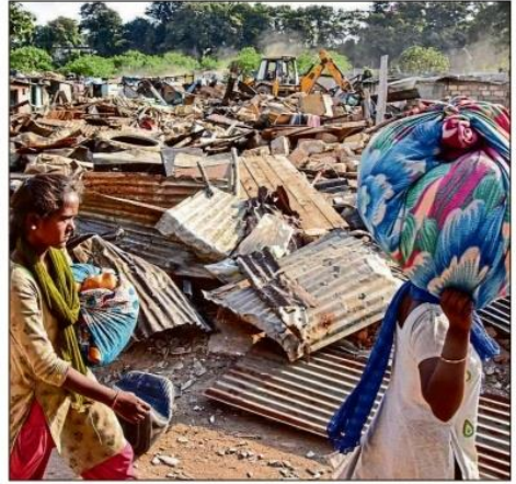
ಬೆದಿ ಮೂಲಕ ಗುಡಿಸಲು ನೆಲಸಮ ಮಾಡಿದರು (ಎಡಚಿತ್ರ) ಬಟ್ಟೆಗಳ ಗುಟ್ಟು ಹೊತ್ತು ತೆರಳುತ್ತಿರುವ ನಿರಾಶ್ರಿತರು

86 ಗುಡಿಸಲು ನೆಲಸಮ • ಕೊಳಚೆ ಪ್ರದೇಶ ಅಭಿವೃದ್ಧಿ ಮಂಡಳಿಯಿಂದ ತೆರವು ಕಾರ್ಯಾಚರಣೆ