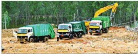
ನಗರದಲ್ಲಿ ಹಲವೆಡೆ ಕೆಲವು ವಾಹನಗಳು ನಿಗದಿತ ಸ್ಥಳದಲ್ಲಿ ತ್ಯಾಜ್ಯ ವಿಲೇವಾರಿ ಮಾಡದೆ, ಎಲ್ಲೆಂದರಲ್ಲಿ ಸುರಿಯುತ್ತಿರುವ ಪ್ರಕರಣಗಳು ಕಂಡುಬರುತ್ತಿವೆ. ಅಕ್ರಮವಾಗಿ ಕಸ ಸುರಿಯುವುದನ್ನು ತಡೆಗಟ್ಟುವ ಉದ್ದೇಶದಿಂದ ತ್ಯಾಜ್ಯ ವಿಲೇವಾರಿ ವಾಹನಗಳಿಗೆ ಜಿಪಿಎಸ್ ಅಳವಡಿಸುವಂತೆ ಸೂಚನೆ ಬಿಬಿಎಂಪಿಗೆ ಪತ್ರ ಬರೆಯಲಾಗುತ್ತಿದೆ.

ತ್ಯಾಜ್ಯ ವಿಲೇವಾರಿಗಾಗಿ ಈಗಾಗಲೇ ಬಿಬಿಎಂಪಿ ಸಾಕಷ್ಟು ಕ್ರಮಗಳನ್ನು ಕೈಗೊಂಡಿದೆ. ಹೀಗಿದ್ದರೂ ಅಕ್ರಮವಾಗಿ ನಗರದ ಕೆಲಸದಲ್ಲಿ ರಸ್ತೆ ಬದಿ, ಹೊರ ವಲಯದ ವರ್ಕುಲ ರಸ್ತೆಗಳು, ವಾರಿ ಜಾಗಗಳಲ್ಲಿ ರಾತ್ರಿ ರಾತ್ರಿ ಕಸ ವಿಲೇವಾರಿ ಮಾಡುತ್ತಿರುವ ಘಟನೆಗಳು ಎಗ್ಗಿಲ್ಲದೆ ನಡೆಯುತ್ತಲೇ ಇವೆ. ಕೆಲಸಗಳ ಪಕ್ಕದಲ್ಲಿ ಕಸ ವಿಲೇವಾರಿ ಮಾಡುವ ಮೂಲಕ ಕೆಲವೆಡೆ